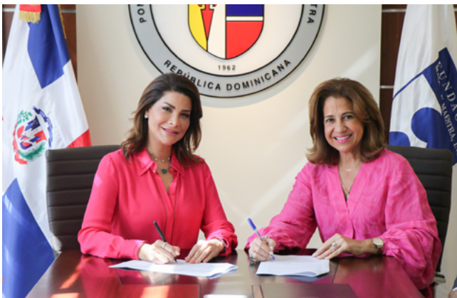
The Doughty Family Foundation