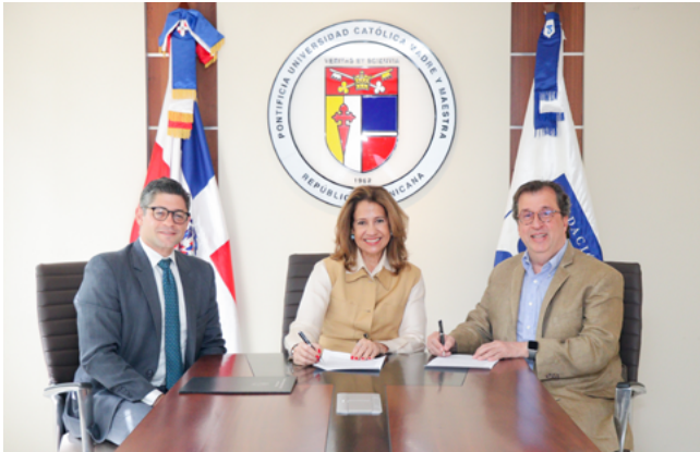
Mera Fondeur Grupo Corporativo