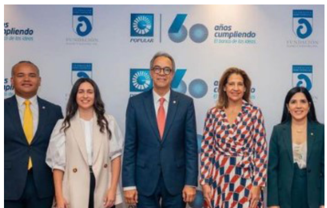
Banco Popular Dominicano