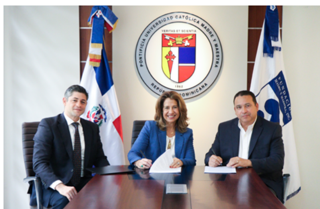
Fundación Manuel Arsenio y Camelia Ureña Inc.